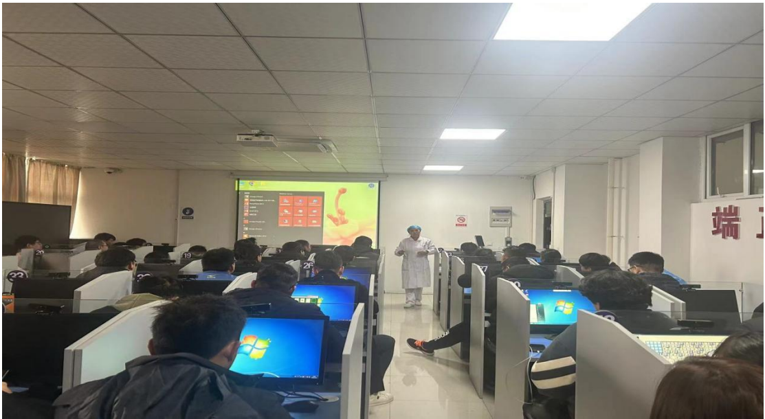
图 20 蚌埠卫生学校教师参与安全生产培训授课