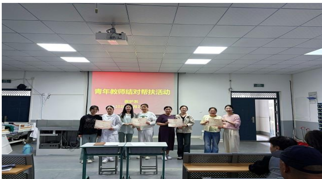
图2 蚌埠卫生学校“青蓝携手 匠心传承”老带新结对帮扶活动

两位老师在日常教学中相互探讨教学方法，交流育人心得，共同解决学生培养过程中遇到的难题，形成了优势互补、协同共进的良好局面。这种“以老带新”的模式，不仅促进了青年教师的快速成长，也为教育教学质量的提升注入了新的活力。