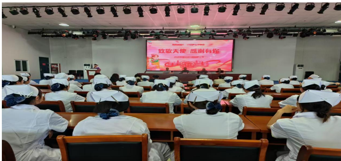
图 16 5.12 护士节活动