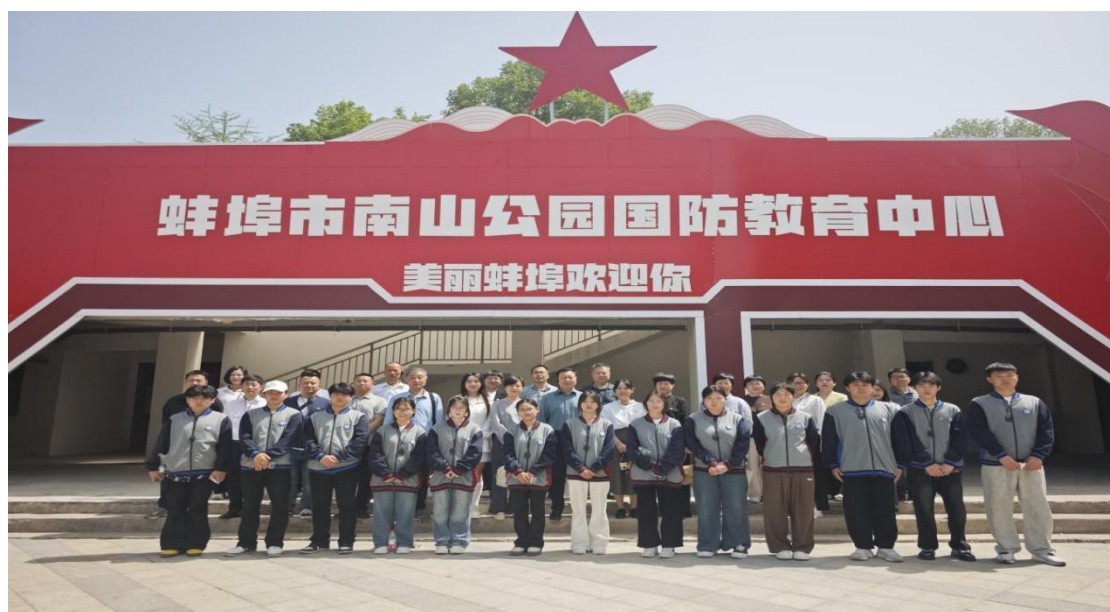
图 26 师生代表前往小南山红色教育基地开展研学实践活动