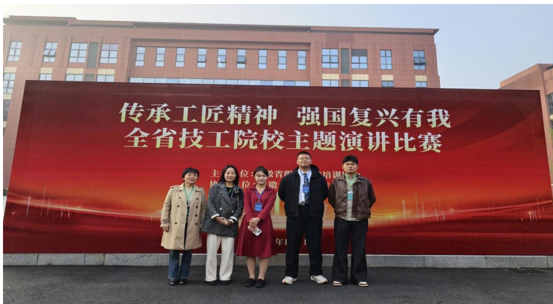
图 34 演讲比赛合照