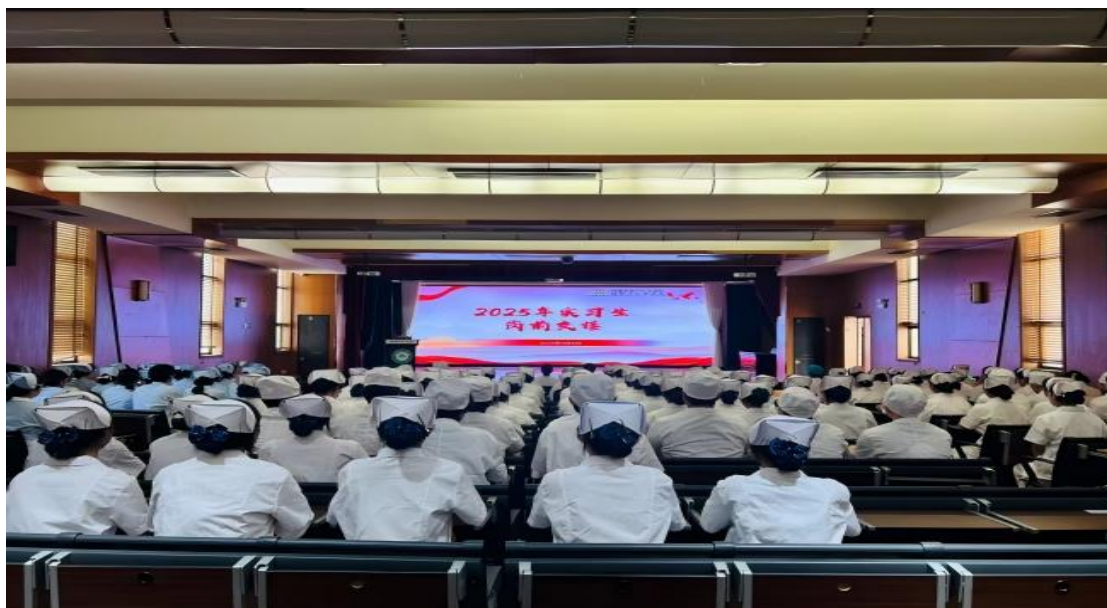
图 38 蚌埠卫生学校学生开展临床实习