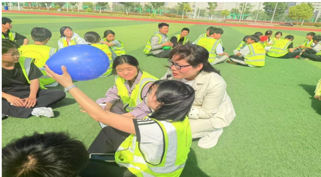
图 3 心理健康户外活动

建“思政课程+课程思政+专业实践”三维育人模式，在《思想道德与法治》课程中增设“医学伦理与法律”专题，在《外科护理学》中融入“抗疫精神”案例，实现思政教育与专业教学同频共振。