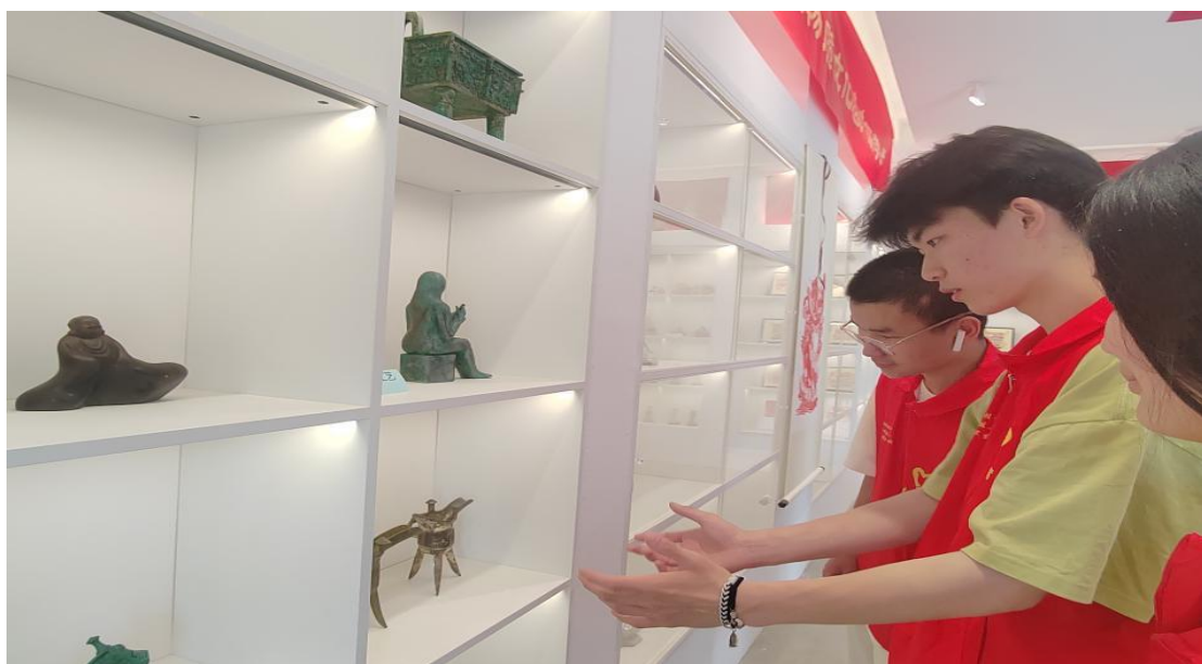
图 28 师生参观双墩遗址公园非遗文化馆