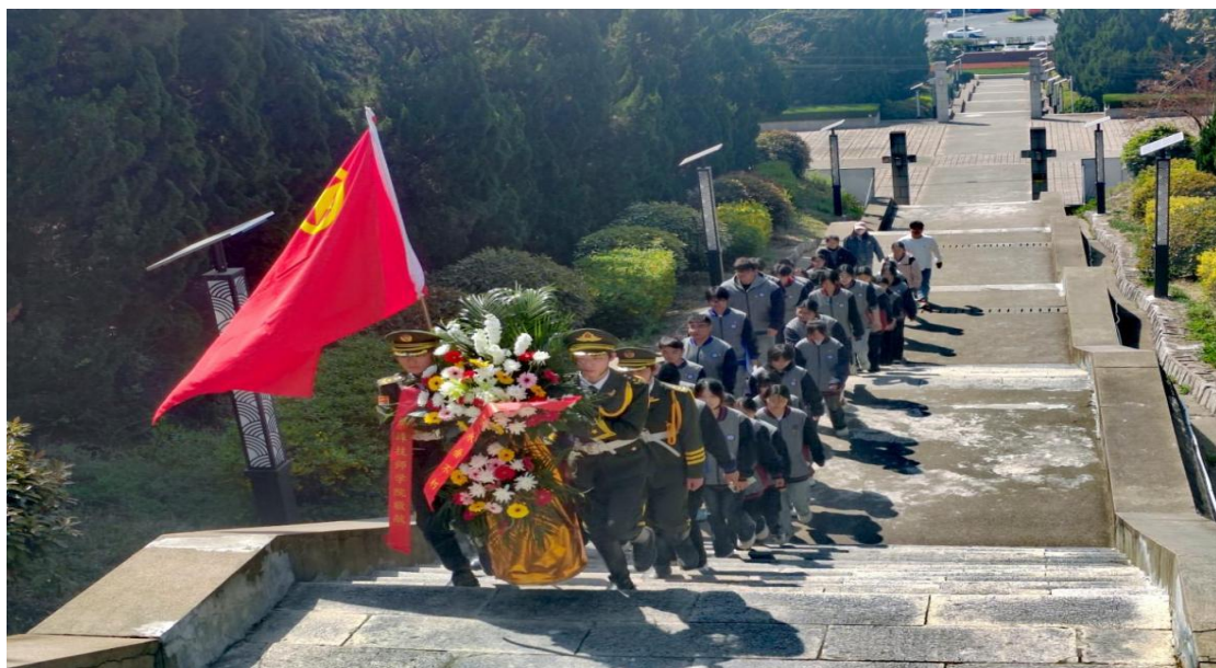
图 25 师生代表前往蚌埠市烈士陵园开展清明祭英烈主题团日活动