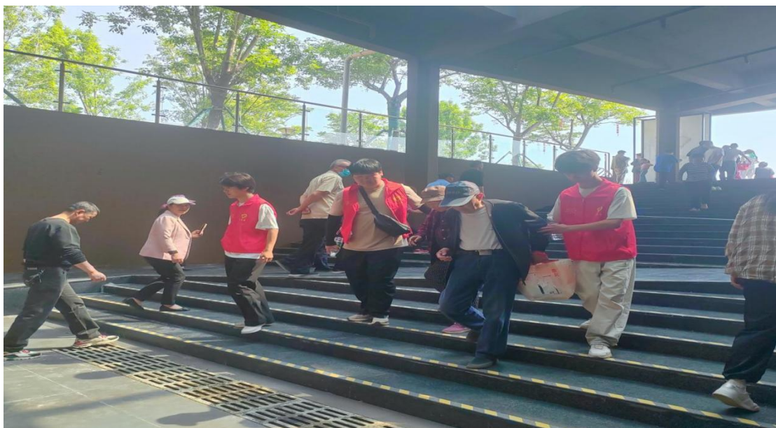
图 17 学校志愿者参与双墩遗址公园开园志愿服务

三是以校园文化活动为抓手，打造沉浸式文化传承场景。精心策划校园文化游园会，以“传承文化基因”为核心宗旨，设置“雅韵投壶”“棋术弈趣”等传统民俗体验区，学生在趣味互动中感受中华优秀传统文化的古韵风雅；同步融入“词韵接龙”“字谜寻踪”等文化闯关环节，在脑力比拼中深化对传统文化的理解与认同。活动累计吸引 400 余名学生参与，营造了“人人爱文化、人人传文化”的浓厚校园氛围。