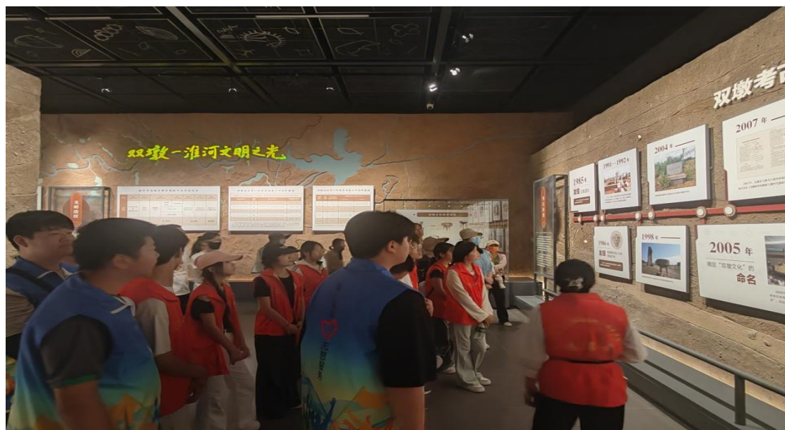
图 27 师生参观双墩遗址博物馆