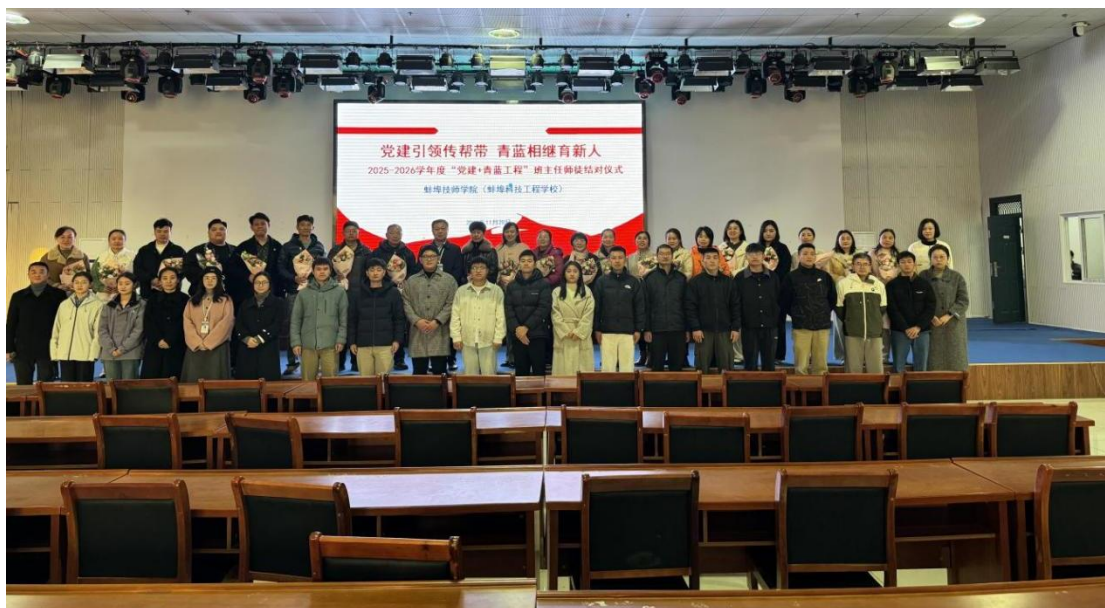
图 44 党建引领传帮带 青蓝相继育新人