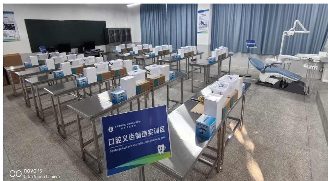
图 42 口腔义齿制造实训室场景