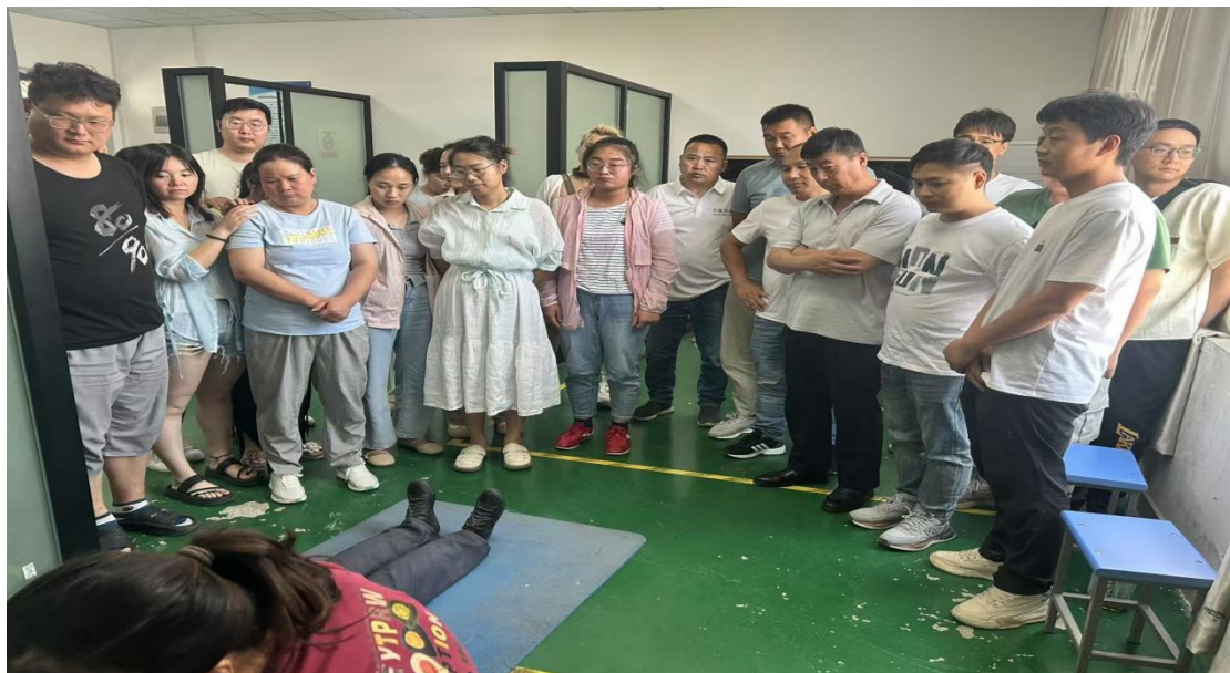
图 21 蚌埠卫生学校教师参与安全生产培训实操授课