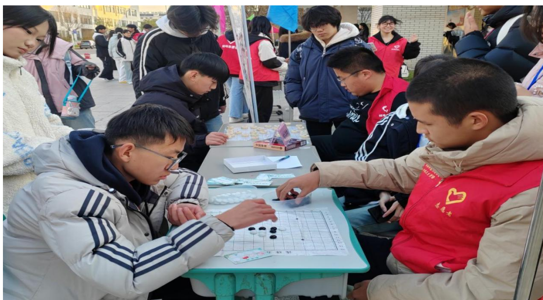
图 19 校园文化游园会“棋术弈趣”活动