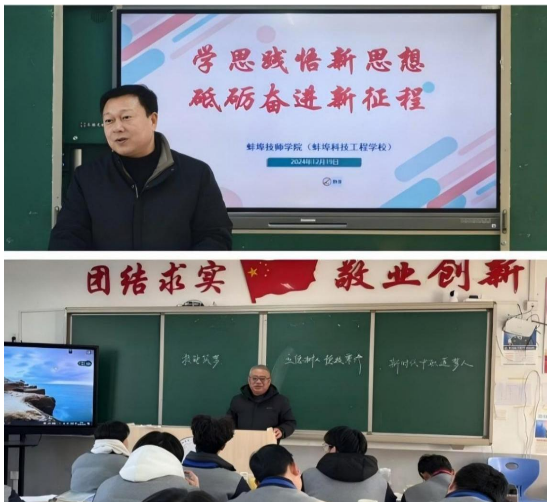
图 4 领导班子成员走进课堂