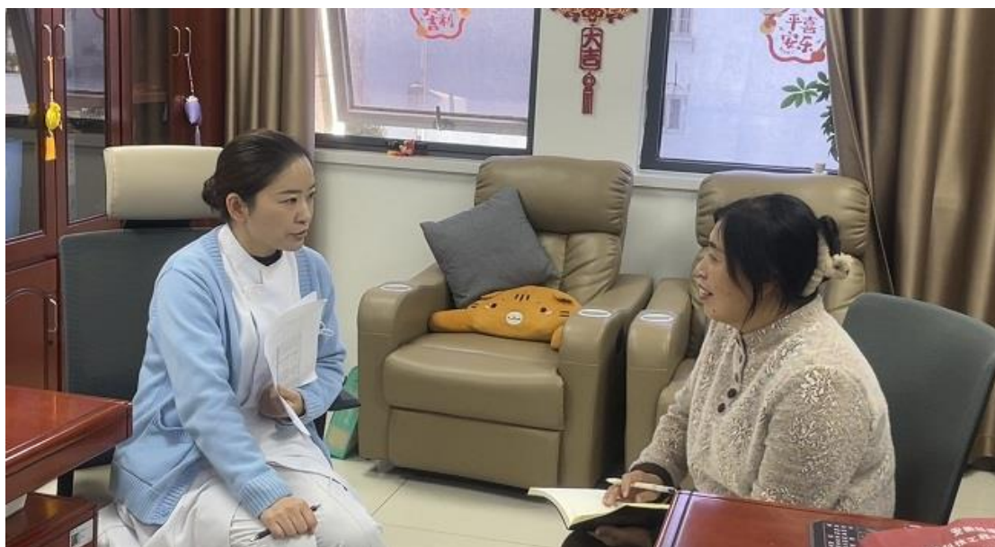
图 39 蚌埠卫生学校学生临床实习实习指导教师与带教老师交流