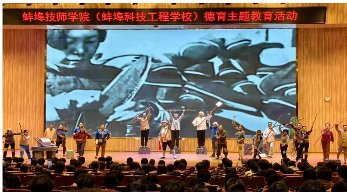
图 12 大型音乐史诗《不朽的丰碑》现场照