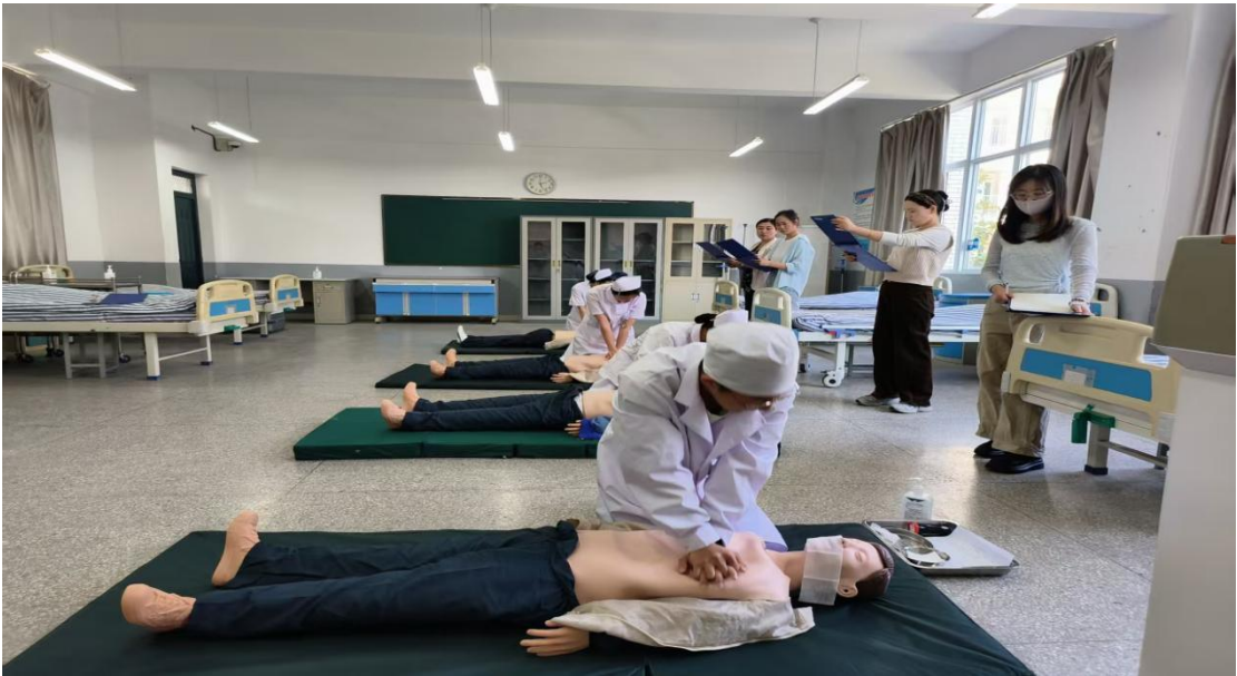
图 8 护理技能比赛-心肺复苏术

未来，蚌埠卫生学校将深入贯彻“五大行动”工作要求，持续加强师资队伍建设，继续以“立德树人”为根本，以医护专业特色为依托，深化“三全育人”综合改革，健全“五育并举”育人机制，为培养更多“有理想、有本领、有担当”的新时代健康卫士不懈奋斗！