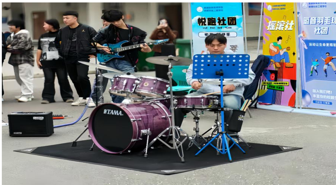
图 29 社团节目串烧课后活动