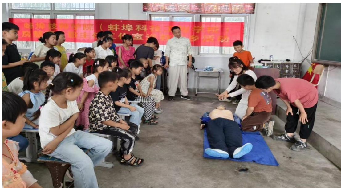
图 24 名班主任工作室赴怀远北严小学开展送教下乡活动