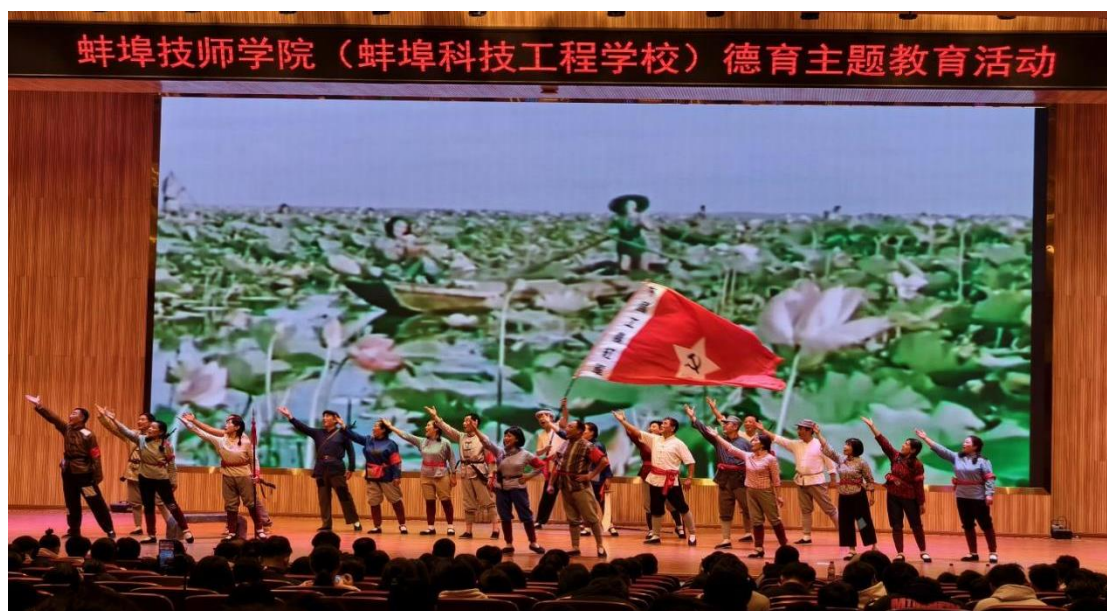
图 11 大型音乐史诗《不朽的丰碑》现场照

时，活动也丰富了校园文化内涵，作为一次高质量的美育实践，营造了传承红色文化、崇尚高雅艺术的校园氛围，提升了师生的审美素养，生动体现了学校“五育并举”的育人理念。此外，此次活动进一步巩固和拓展了学校的德育工作品牌，与社会专业文化力量的合作为整合校外优质教育资源提供了经验，彰显了学校在思想政治教育工作上的主动性、创新性与实效性，为培养担当民族复兴大任的新时代高素质技能人才营造了昂扬向上、凝心聚力的良好育人生态。