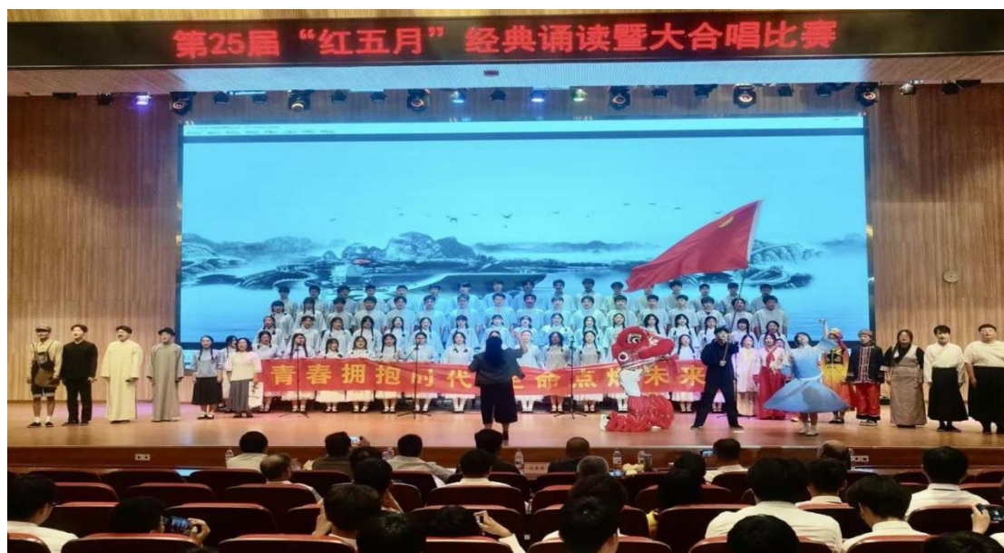
图 36 “红五月”经典诵读暨大合唱比赛现场