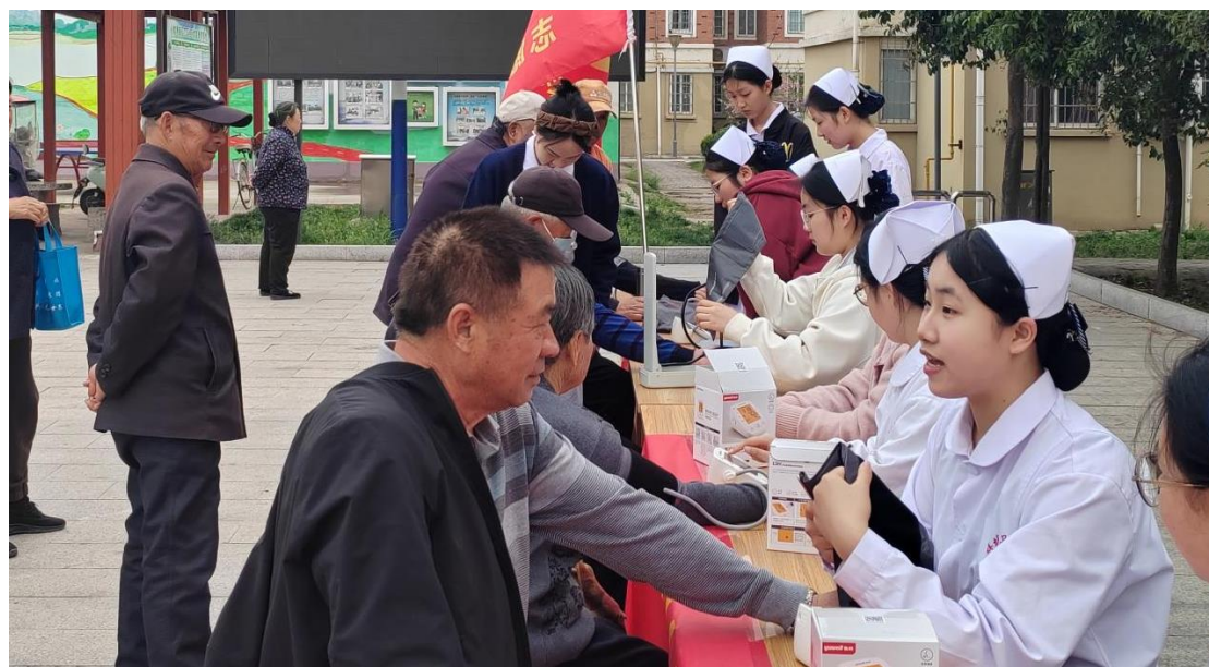
图 33 学校开展“‘锋’彩社区，温暖同行”志愿服务活动