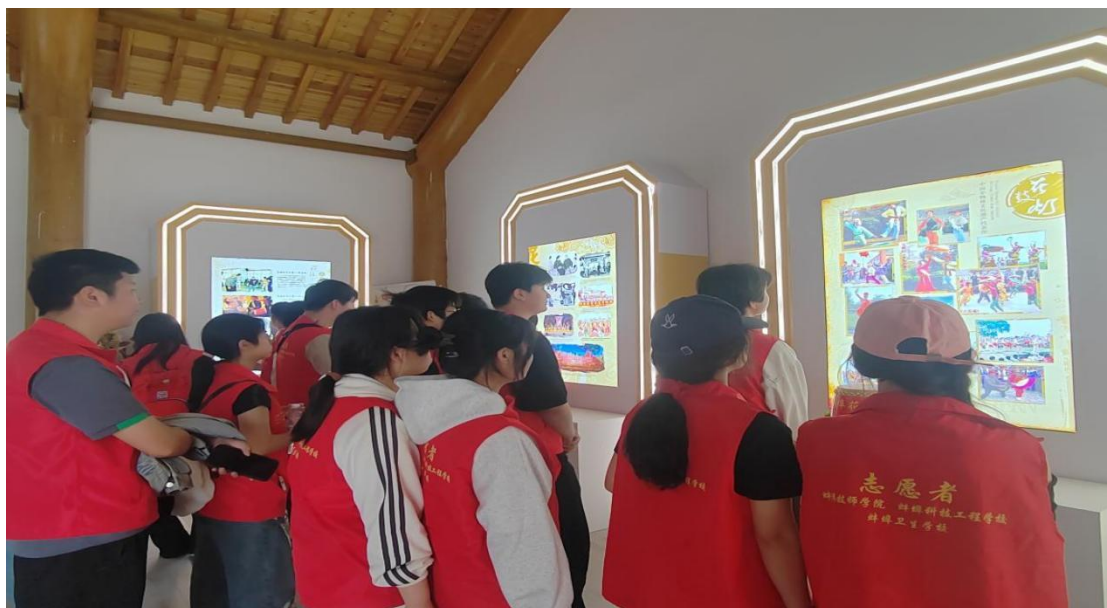
图 18 学生参观双墩遗址公园非遗文化馆