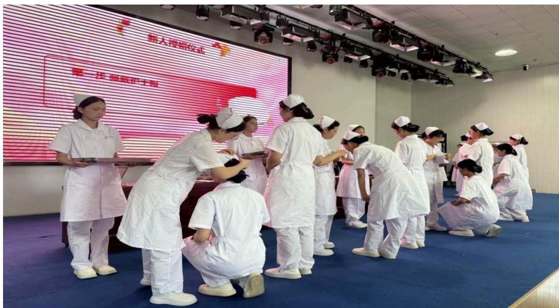
图 7 5.12 护士节 授帽仪式