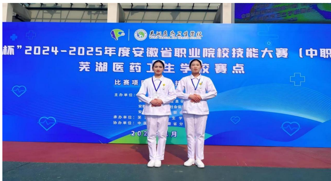
图 13 技能大赛选手现场照