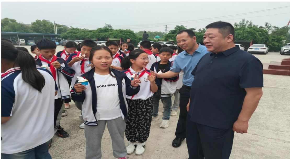
图 31 蚌埠卫生学校党委书记带队开展职业体验活动

二是强化校内资源建设，通过“名师课堂开放日”、“金牌工匠面对面”分享会等形式，展示理实一体教学魅力，发挥榜样引领作用；三是推进职普融通，组织师生赴乡村小学开展职业启蒙活动，传播工匠精神。年内累计开展重点职业启蒙活动 6 场次，覆盖校内学生逾千人次，并辐射至社区及小学。成效显著，有效激发了学生的职业兴趣与学习热情，增强了社会对职业教育的认同感，为构建现代职业教育体系、服务地方发展奠定了坚实基础。