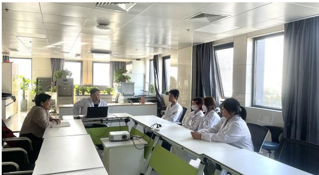
图 40 蚌埠卫生学校临床实习学生座谈会