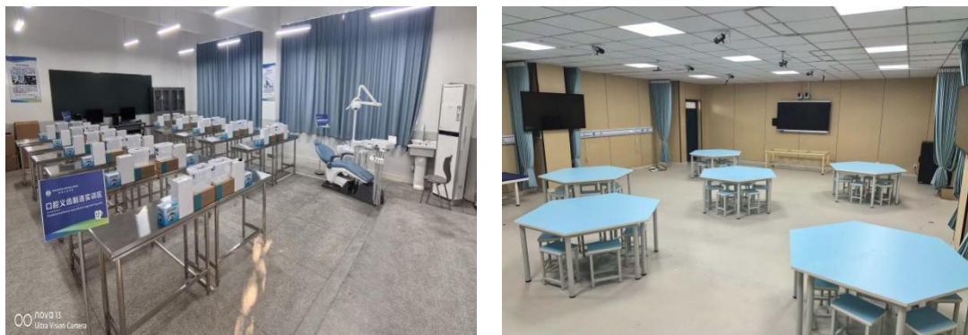
图 1 蚌埠卫生学校部分实验实训室照片