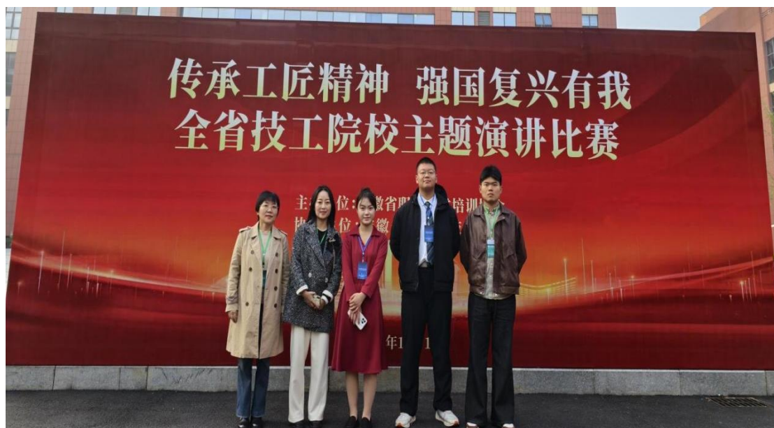
图 23 “传承工匠精神 强国复兴有我”全省技工院校演讲比赛

阻（海姆立克急救法）等紧急场景的科学应对步骤。一场送教，播下两颗种子：八段锦的“治未病”智慧，让预防大于治疗的意识扎根；急救技能的“及时雨”，为校园安全筑牢防线。名班主任工作室正以健康为纽带，编织城乡教育共进的锦缎，让优质教育成果惠及每一株“青苗”。