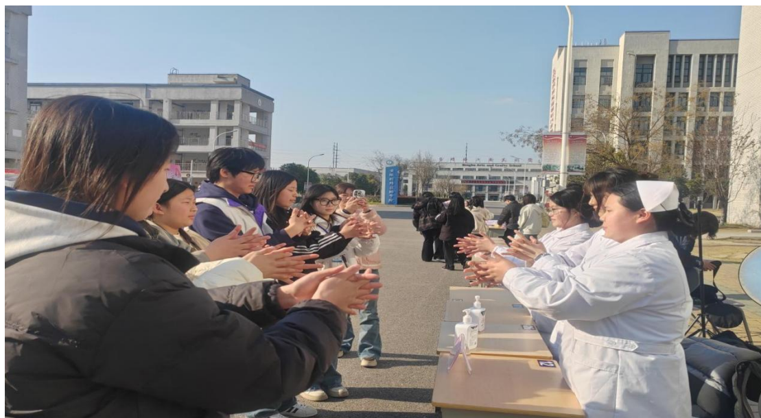
图 32 学校开展“雷锋精神展风采，青春力量显担当”主题课后实践活动