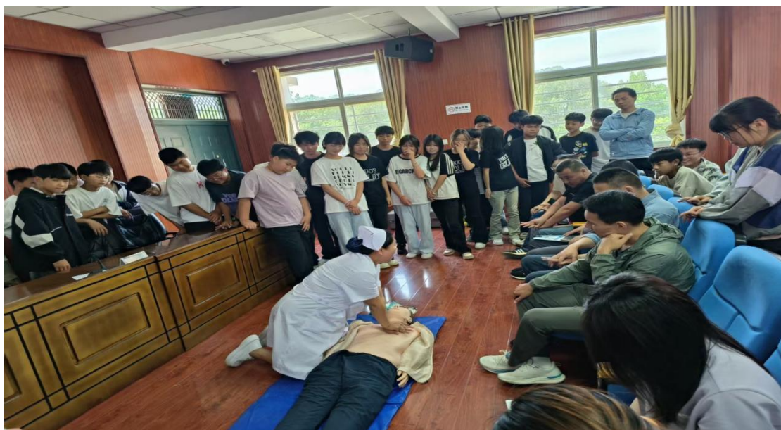
图 37 “职业启蒙”教育走进曹老集中学

急救知识，筑牢健康成长安全防线；另一方面让学生近距离接触护理专业，深刻感受医护工作者的责任与担当，实现职业认知启蒙。同时，活动以党建联动搭建了校际党建与教学交流桥梁，党员教师以实干践行初心使命，彰显了教育工作者的奉献精神，充分展现了学校职业启蒙教育服务社会的育人价值。