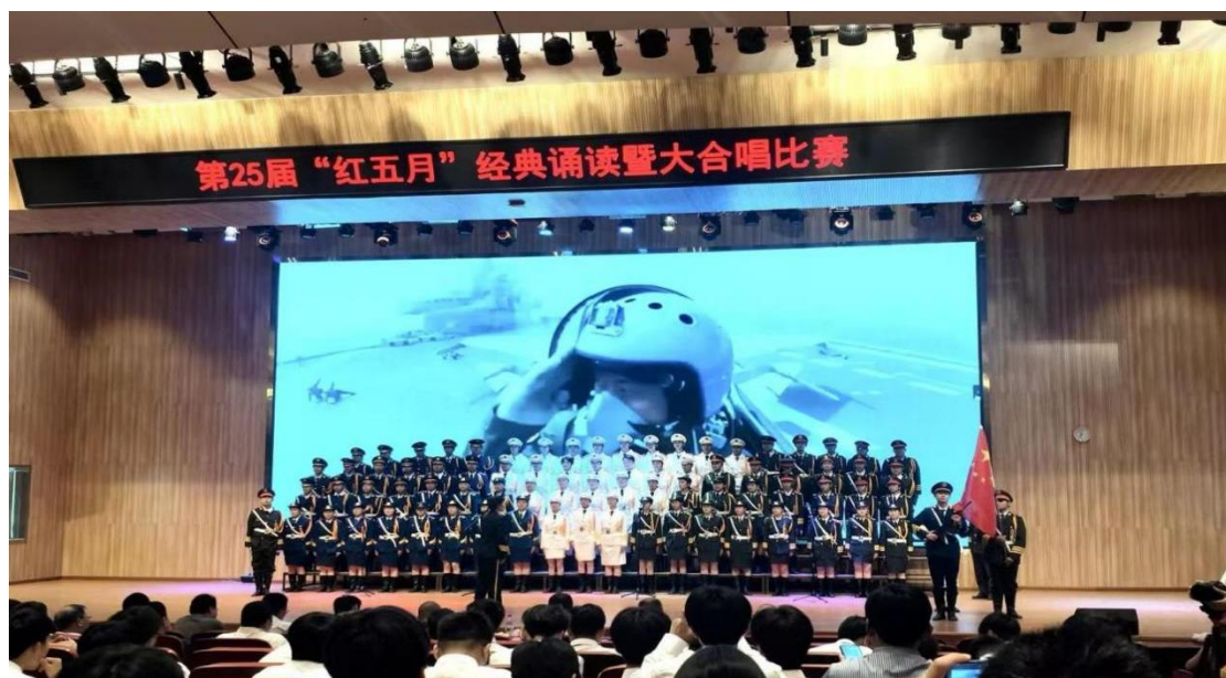
图 35 “红五月”经典诵读暨大合唱比赛现场

此次“红五月”活动既是生动的爱国主义教育课，也是学校德育工作的成功实践。学校始终坚持将思政教育、法治教育等融入各类活动，以红色基因滋养初心，以优秀文化浸润心灵，以工匠精神锤炼品格，持续夯实“五育并举”育人根基，为培养担当民族复兴大任的高素质技术技能人才赋能。