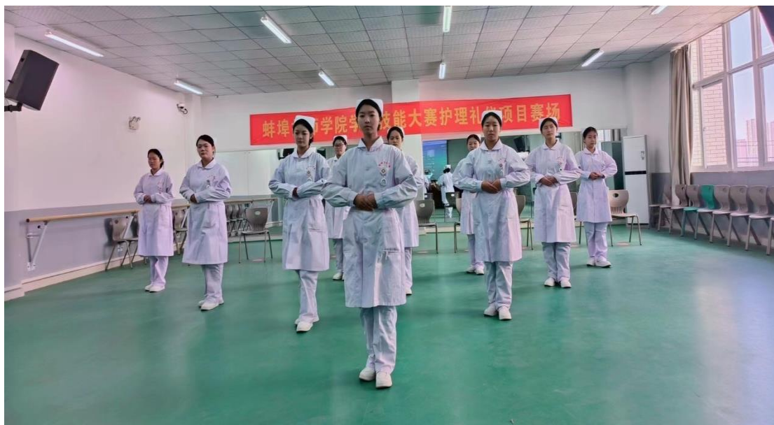
图 10 护士礼仪大赛展示