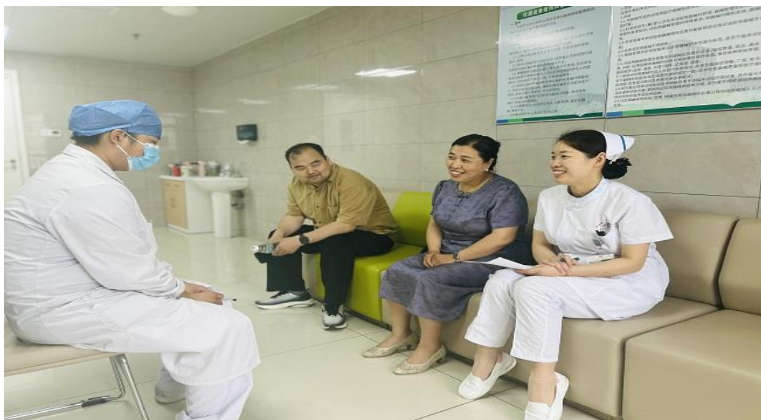
图 41 开展实习期间思想工作