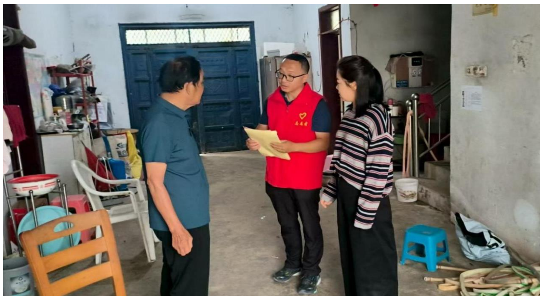
图 22 扶贫干部进农家，把脉困难谋发展