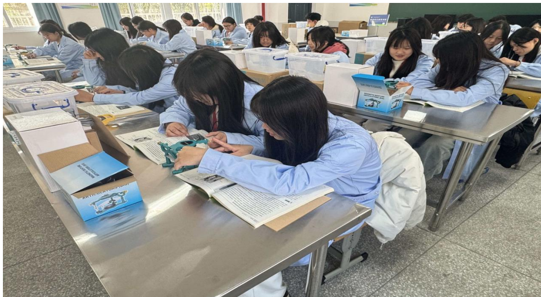
图 43 口腔义齿制造实训课场景

通过校企合作，企业参与人才培养，降低了用工培训成本、实训设备投入不足、双师型教师不足等各类难题，实现教育链、人才链与产业链、创新链的深度融合，形成“校、企、生三方共赢”的良性循环。