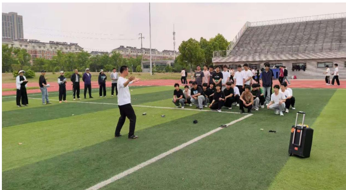
图 6 “五育”融太极公开课