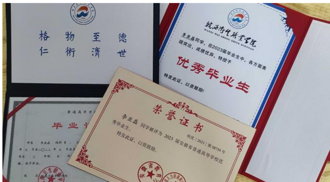
图 14 李亚磊同学荣誉证书