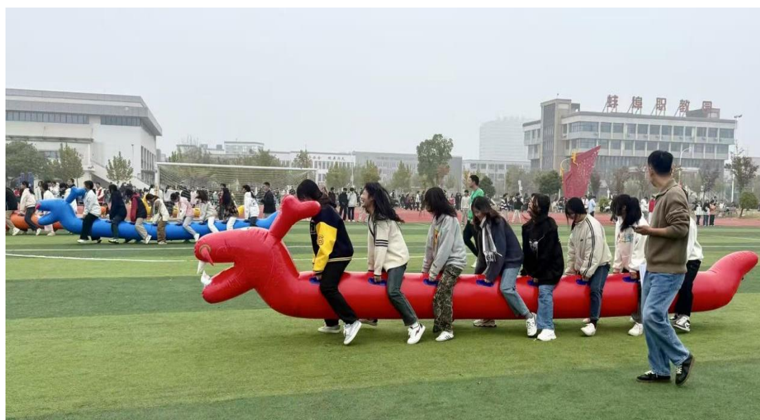
图 5 运动会“跑龙舟”集体项目比赛